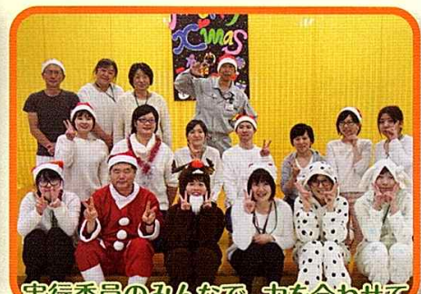
実行委員のみんなで、力を合わせて一生懸命頑張りました♡♡♡