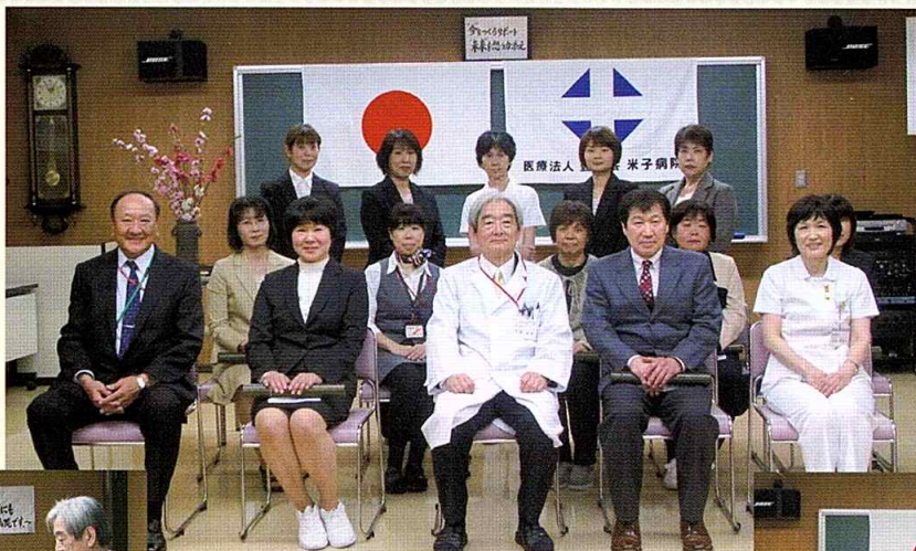
永年勤続表彰者の 記念撮影