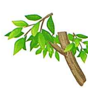
5 病棟 看護師 前島 さき

精神科での勤務は未経験であり、不安もありますが患者さんらしさを大切に関わっていきたく思います。米子病院の力になれるよう精一杯頑張りますのでよろしくお願い致します。