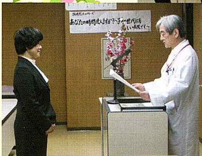
永年勤続表彰の様子