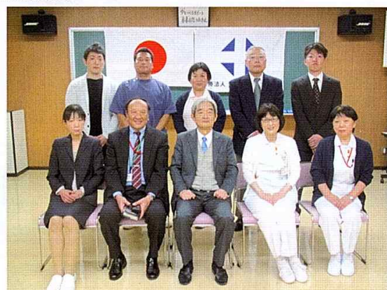
永年勤続表彰者の記念撮影