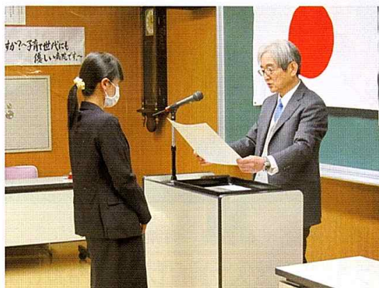
永年勤続表彰の様子