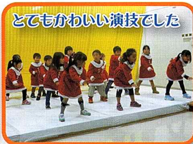
とてもかわいい演技でした