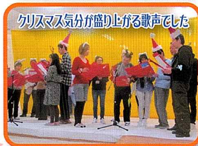
クリスマス気分が盛り上がる歌声でした