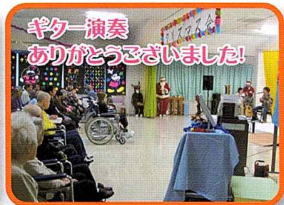
ギター演奏 ありがとうございました!