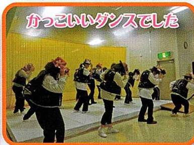
カッコいいダンスでした