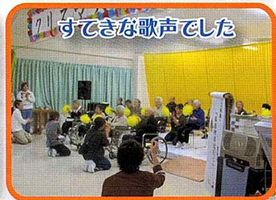
すてきな歌声でした