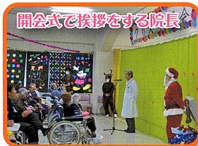
開会式で挨拶をする院長

今年は友情出演によるギター演奏から始まり、この季節に合わせて作曲した歌を披露して下さいました。クリスマスムード満点の中、皆さん最後まで音楽に合わせて手拍子したり、体でリズムをとったりと、とても良い表情でした。また着ぐるみのサンタやトナカイも会場内を飛び回って来場者を楽しませていました(*^_^*)